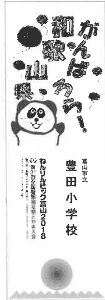
① 応援メッセージ入りのぼり