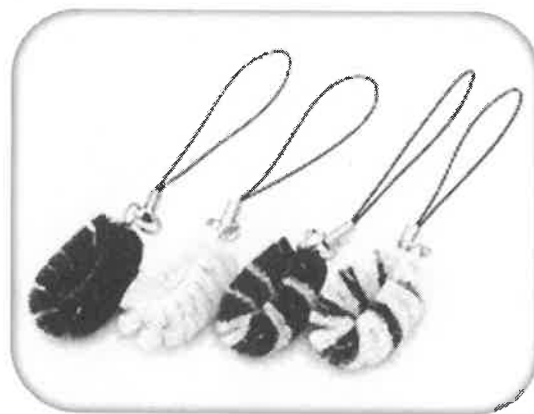
たわしストラップ