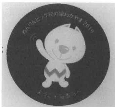
紀州漆器マグネット

大会参加選手・監督等に対して、海南市の特色を生かした「紀州漆器マグネット」や「たわしストラップ」、「蔵出しみかんジュース」、「梅酒」などの記念品を贈呈し、和歌山大会の記念とするとともに、海南市のPRにつなげる。