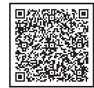
粗大ごみのお申し込み