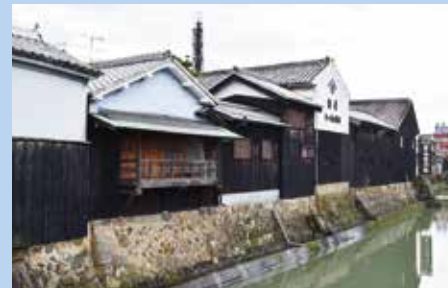
重要伝統的建造物群保存地区(湯浅町)