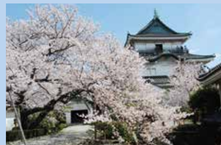
和歌山城(和歌山市)