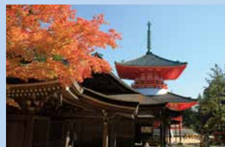
高野山 根本大塔(高野町)