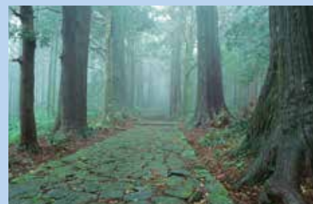
那智山大門坂(那智勝浦町)