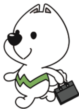
和歌山県PRキャラクター「がいちゃん」