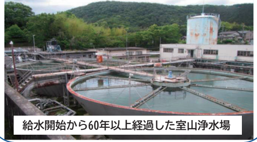
給水開始から60年以上経過した室山浄水場

水道事業は原則として水道使用者の皆様からいただく水道料金によって運営しています。良質な水道水を安定的にお届けするためには、浄水施設や送水・配水施設など多くの施設(※)を要し、これらの施設の計画的な更新や適切な維持管理には、多額の費用が必要となります。