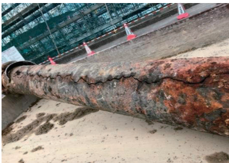
老朽化した水道管