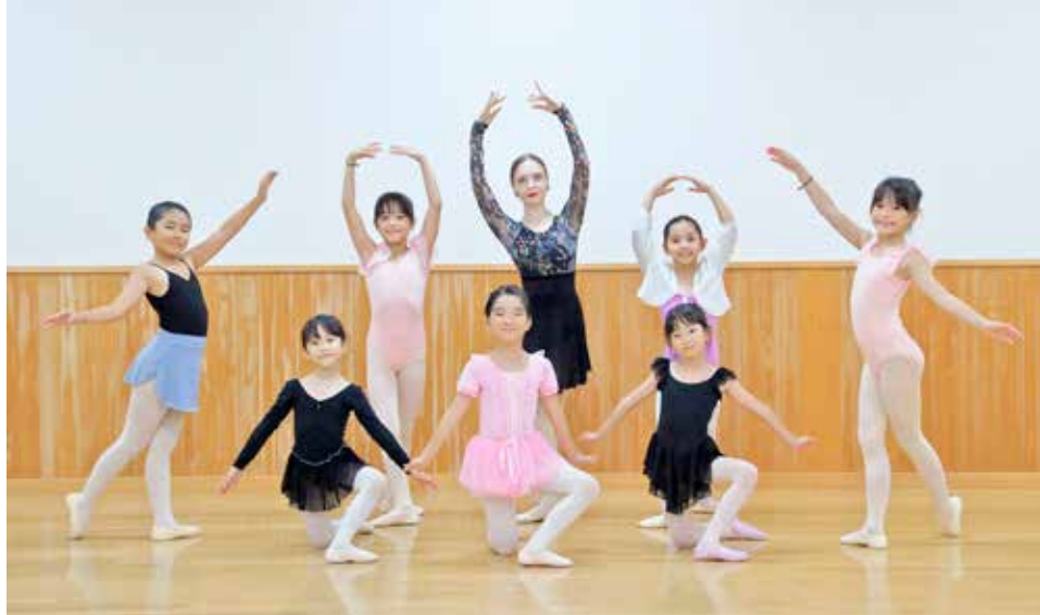
▲クリスティーナさんと生徒たち