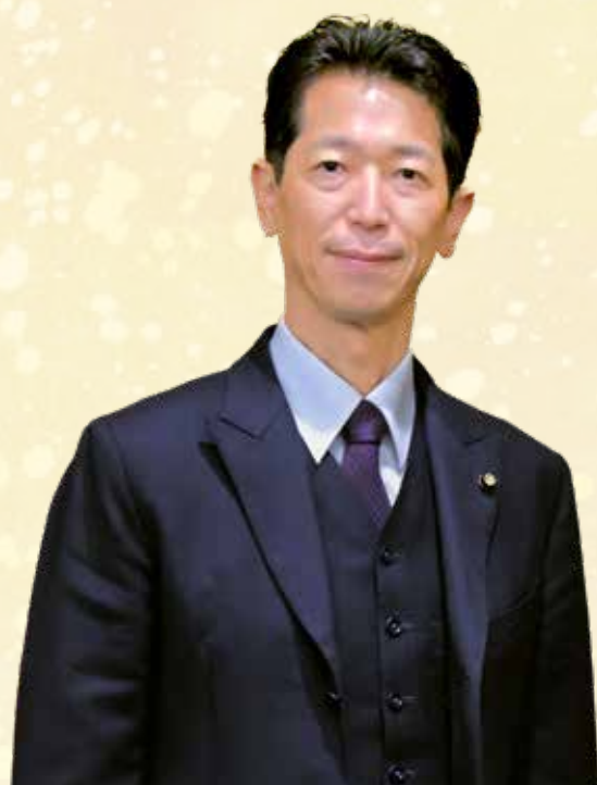
海南市議会議長 宮本 憲治

結びに、本年が皆様方にとりまして、明るく幸多き年となりますとともに、大いなる飛躍の年となりますよう心からお祈り申し上げます。新年のご挨拶と致します。