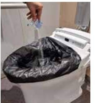
携帯トイレを取り付けた様子

また、「能登町 うかわ 鵜川地区では、多くの家屋が倒壊しましたが、迅速な安否確認や救助活動をし、全員の命が助かった。 日頃から避難計画の作成や防災訓練などに取り組んでいた。 」とのこと。道路が寸断されるような大規模災害時には、 住民同士が助け合う「共助」 の力が不可欠です。そのためには、日頃から、自治会や自主防災組織の活動を通じて、顔の見える関係を築いておくことが重要です。