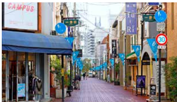
▲レンガ調が素敵な一番街商店街