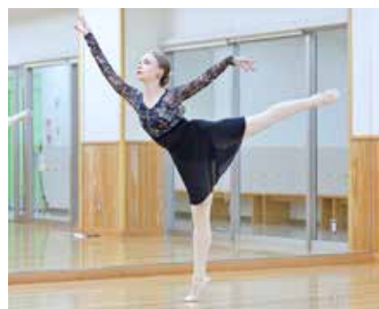
▲教室が始まる前に見せてくれたしなやかなポーズ

ロシア連邦出身。3歳からバレエを始める。中国でバレエ教室を展開する企業に就職。2年前の結婚を機に海南市に移住し、現在、市内でバレエ講師をしている。