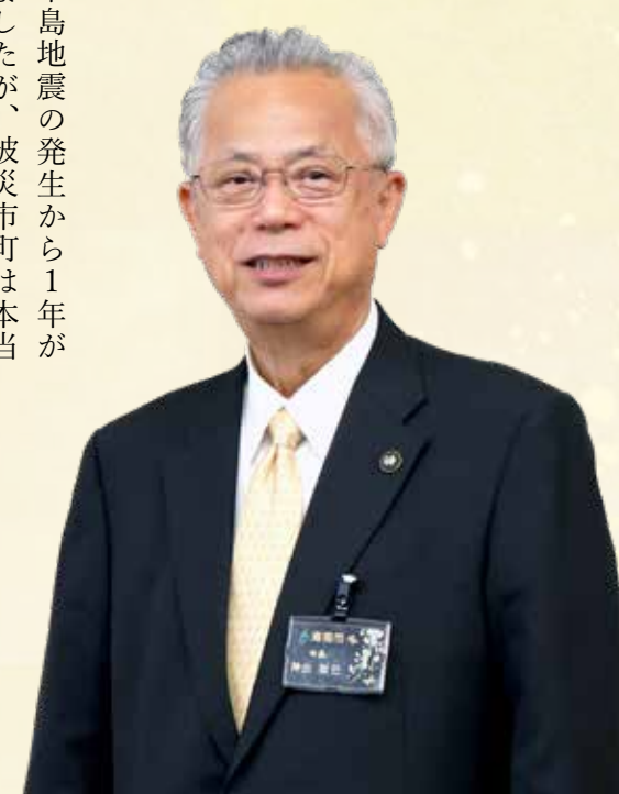
海南市長 神出 政巳