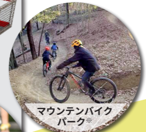
マウンテンバイクパーク※