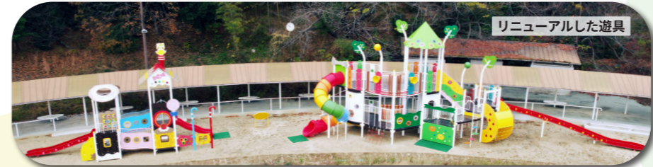
リニューアルした遊具

平時には多世代が集い、大規模災害時には防災の拠点や応急仮設住宅用地となる市民防災公園「海南ハレアメ」では、芝生広場や大型遊具、ドッグラン、マウンテンバイクパーク、体験学習館などの整備を進めています。令和8年春の開園にご期待ください。