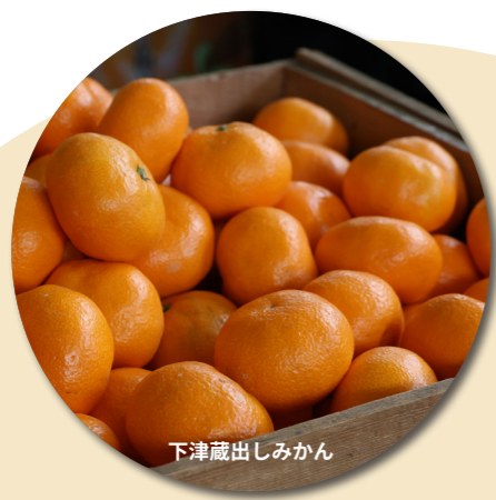
下津蔵出しみかん