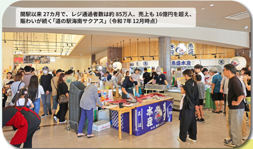
開駅以来 27カ月で、レジ通過者数は約85万人、売上も16億円を超え、賑わいが続く「道の駅海南サクアス」(令和7年12月時点)

令和7年9月に開駅2周年を迎えた道の駅海南サクアスには、連日、県内外から多くのお客様が、新鮮な野菜や果物、海産物、地場産品を求めて訪れています。令和7年5月には、全国で79駅しかない「防災道の駅」に選定されるなど、災害時の支援拠点としての機能も備えています。