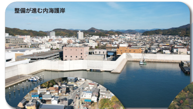
整備が進む内海護岸

津波防波堤、水門、護岸などを組み合わせた国の直轄による津波対策事業が進んでいます。また、令和7年6月の国道42号有田海南道路の開通に続き、令和8年1月には県道海南金屋線(鏡石トンネル)が開通予定です。災害時の交通確保、通行の安全性向上が期待されます。