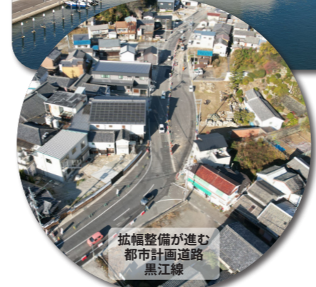
拡幅整備が進む都市計画道路黒江線