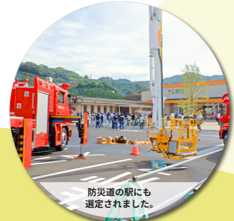
防災道の駅にも選定されました。