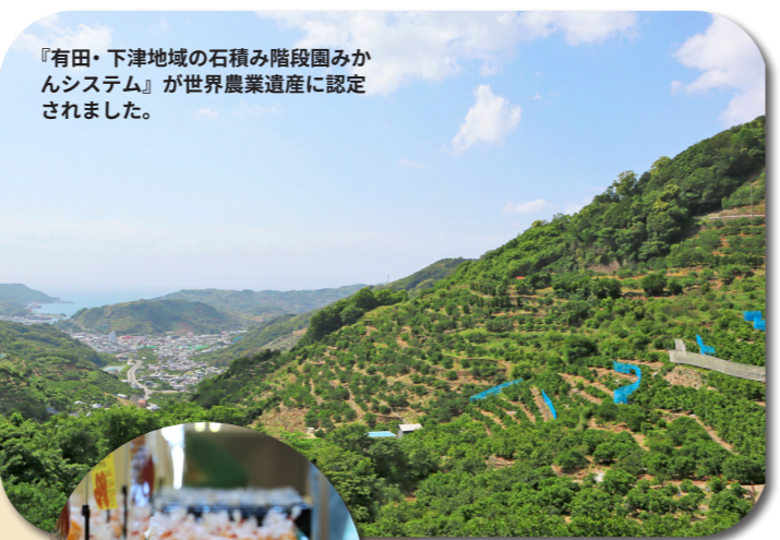
『有田・下津地域の石積み階段園みかんシステム』が世界農業遺産に認定されました。