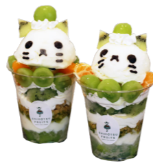
2周年記念で限定販売したオリジナルスイーツコンテスト入賞作品『ごきげんパフェ』 ※現在は販売を終了しています。