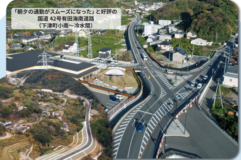
「朝夕の通勤がスムーズになった」と好評の国道42号有田海南道路(下津町小南～冷水間)