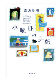
水曜日の手紙 森沢 明夫 / KADOKAWA

何かに悩み、行き詰ったとき、港町の波の音、潮の香りを感じながら、海をゆったりと眺めていると、赤い灯台が人生の道しるべを示してくれる。そんな物語を感じさせてくれる場所がここにもあります。