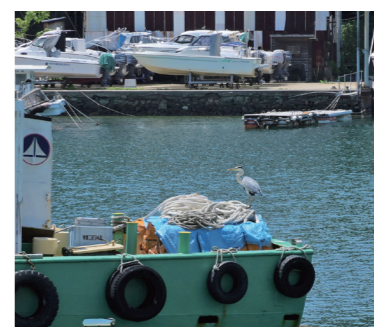
船でひと休みするサギの様子は海辺ならではの光景。

本市の市域には、海・山が存在し、少し移動すれば違った表情が顔を出します。景色はもちろん、その場で流れる音や空気に含まれる香りも山側と海側では全く違います。