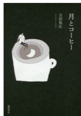
月とコーヒー 吉田 篤弘／徳間書店