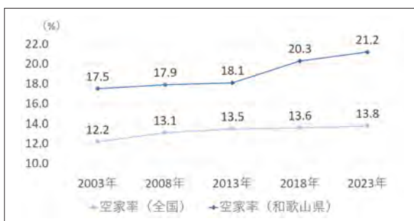
■ 全国および和歌山県の空家率の推移