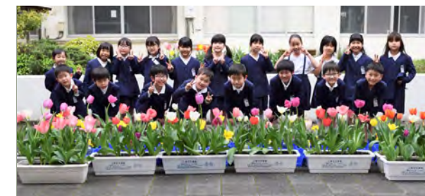
最優秀賞 日方小学校の皆さん