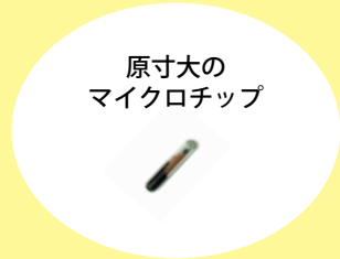
原寸大の マイクロチップ

令和4年6月1日に「改正動物愛護管理法」が施行され、販売される犬や猫へのマイクロチップの装着・登録が義務付けられました。犬や猫を家族に迎え入れた飼い主は自分の住所や氏名、電話番号を変更登録する必要があります。