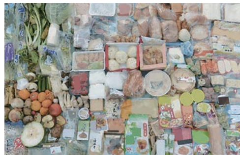
捨てられた手付かずの食品例

食べられるのに捨てられている食品ロスのこと。 日本では、年間約600万トンの食品ロスが発生しています。 食品ロスの中には、手付かずの状態ですべて捨てられている食品もあり、この状況を多くの方に知っていただくことが大切です。