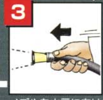
ノズルを火元に向ける