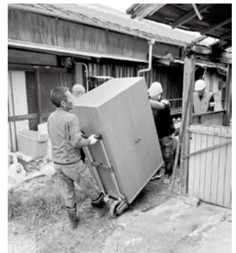
災害ボランティア活動の様子

答：災害ボランティアセンターを運営する社会福祉協議会では、ボランティアの皆さんに大正温泉や海南スポーツセンターのシャワーを利用いただけるよう調整済みである。その他の提携についても、社会福祉協議会と調整したい。