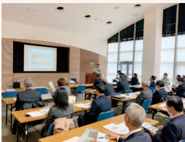
和歌山県果樹試験場

海南市・紀美野町の全議員で構成する海南・海草議会議員連絡協議会では、「海南・海草地域の活性化と地域づくり」を運動目標に掲げ、広域的な課題について調査・研究を行うべく活動しています。