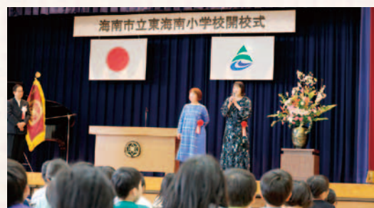
校歌作詞作曲者表彰