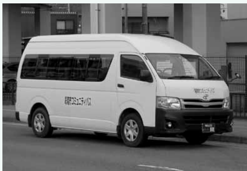
海南市コミュニティバス

地域公共交通の拡充に関する地域への聞き取り調査や、コミュニティバス及びデマンドタクシーの利用実態などの調査を進める。