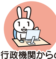
行政機関からの お知らせ・各種証明書