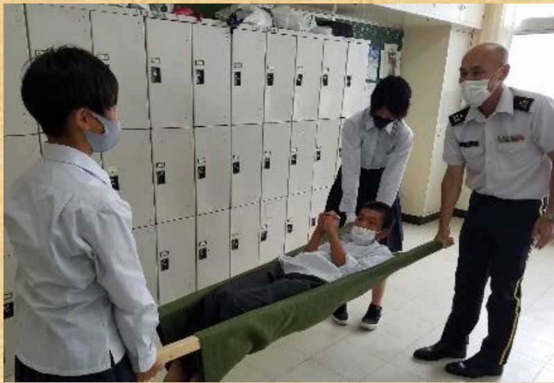
応急担架による患者搬送