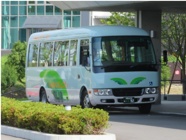
(KIP線・七山線・七山沖野々線車両)