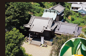
みかんの神「田道間守」を祀る橘本神社