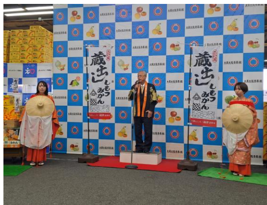
大阪本場市場セリ前のセレモニー