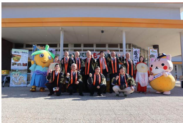
結団式（道の駅 海南サクアス）