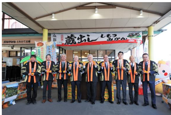
結団式（とれたて広場）