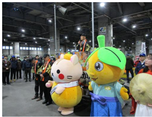
札幌市中央卸売市場でのセレモニー